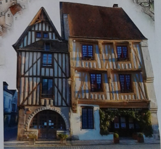
Doc 4 Une maison à colombages à Noyers (Yonne)