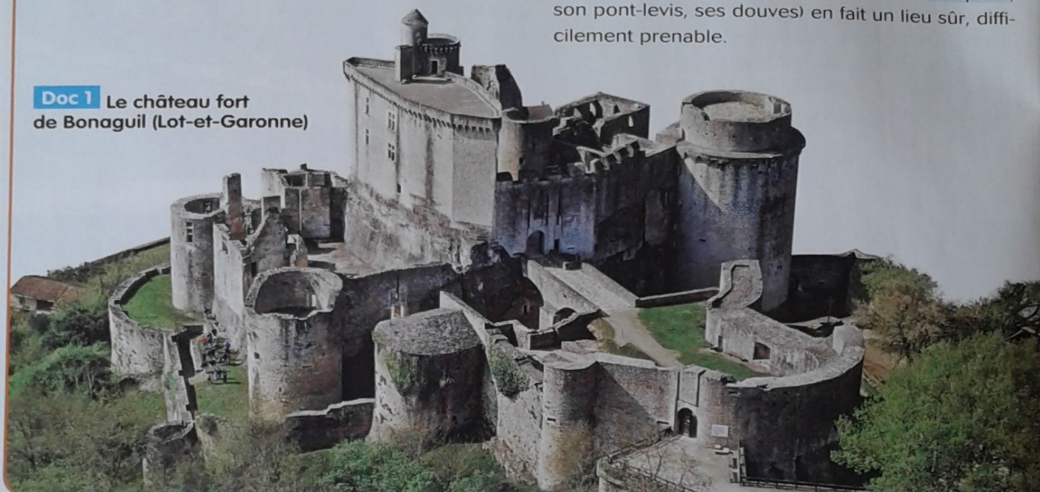
Doc 1 Le château fort de Bonaguil (Lot-et-Garonne)

viennent se réfugier, en cas d'attaque, les paysans qui travaillent sur les terres du seigneur. En effet, l'architecture du château fort (avec ses remparts, son pont-levis, ses douves) en fait un lieu sûr, difficilement prenable.