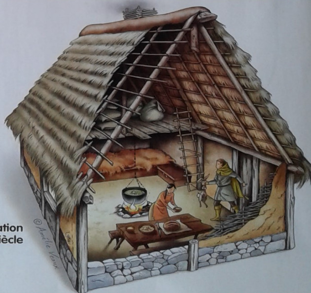
Doc 2 Une habitation paysanne au XV e siècle

Au Moyen-Âge, la vie des paysans est dure. Ils habitent dans des maisons très simples, composées d'une seule pièce. Le sol est en terre battue, les murs en terre ou en bois, et le toit en chaume.