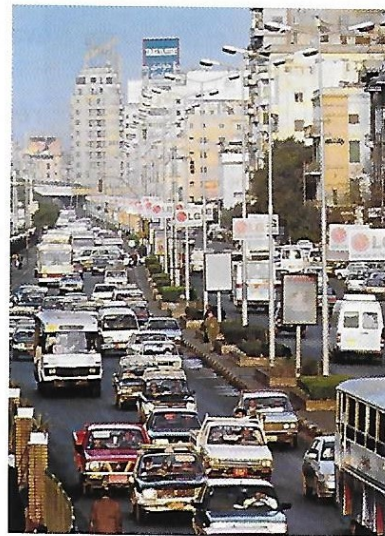
Le Caire (Égypte).

Okapi n° 826, 15 mai 2007, © OKAPI, Bayard Jeunesse.