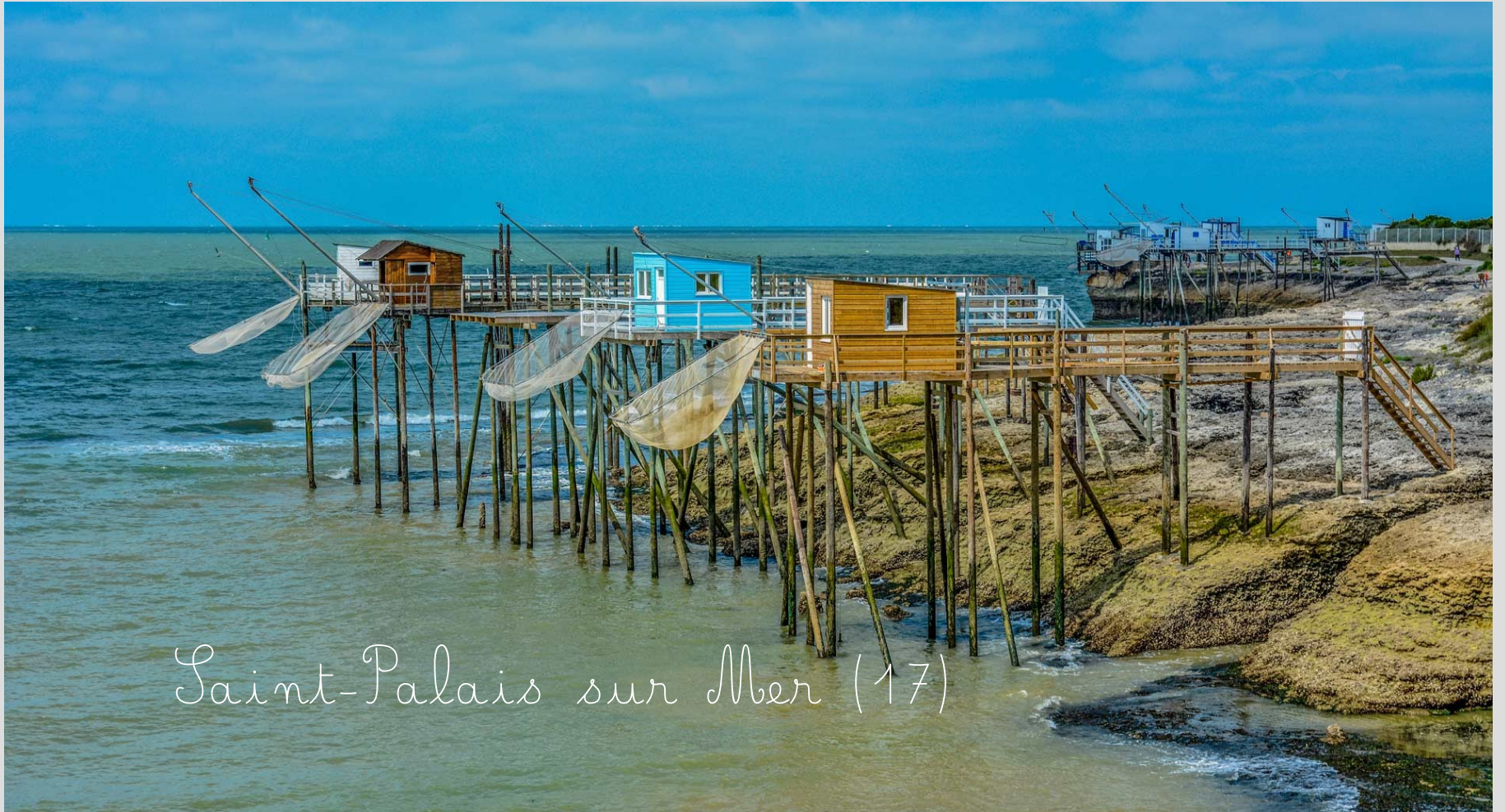
Saint-Palais sur Mer (17)