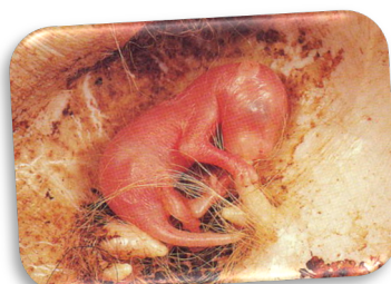
À la naissance