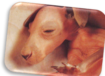
À 1 mois