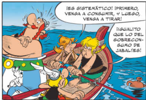
Extrait de l'album La Fille de Vercingétorix