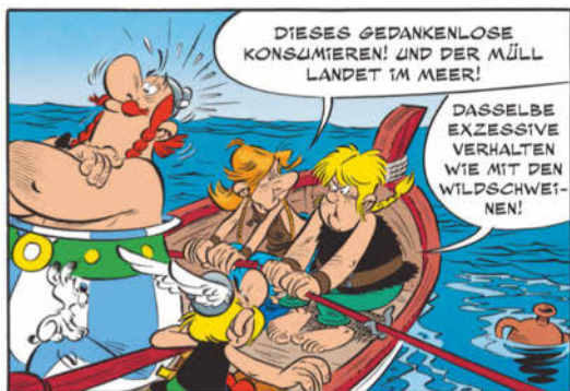
Extrait de l'album La Fille de Vercingétorix