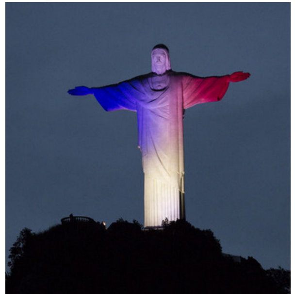
Le symbole de paix associé à celui de la Tour Eiffel est repris partout à travers le monde.