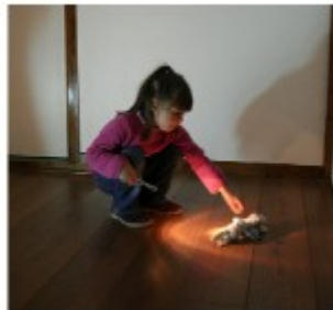
ombres et lumières

Le même parcours pourra être réalisé ensuite avec des lunettes de soleil, ou avec un bandeau plus ou moins opaque sur les yeux.