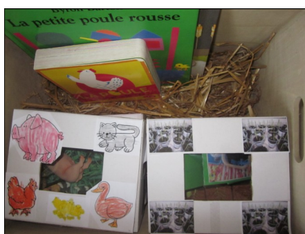
Dans notre boîte, il y a d'autres boîtes...et des livres.