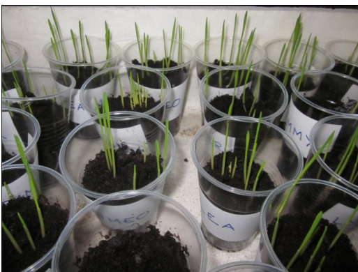
L ATTENTE PUIS LA GERMINATION