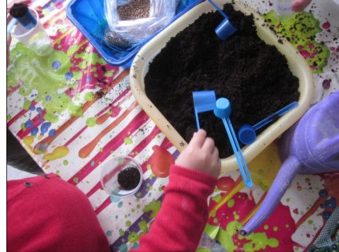
LE MATERIEL NECESSAIRE