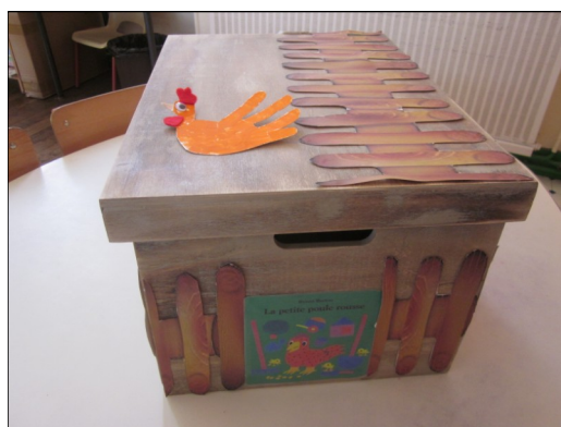
Notre boîte à histoire...

Au cours de cette période, nous avons lu et travaillé l'album « la petite poule rousse » de Byron Barton. Ce travail qui concernait tous les domaines d'apprentissage a donné lieu à l'élaboration d'une boîte à histoire qui sera exposée avec d'autres boîtes d'autres écoles du 10 avril au 13 mai à la médiathèque de Melle. Voici les photos d'une partie de ce travail.