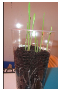
LES RACINES (leurs fonctions) LA TIGE