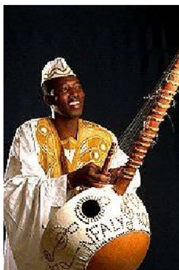
Par la CLIS 4 de B.Profit. Voir page 4