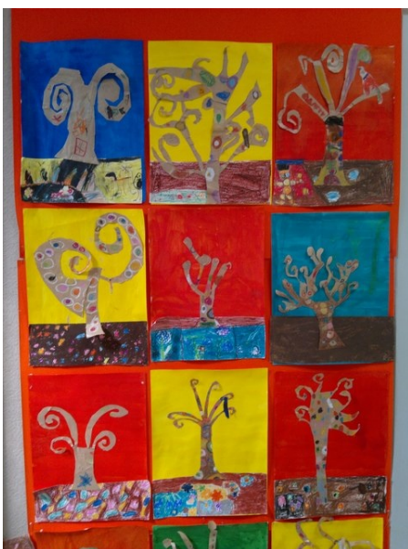
Les Ce1 et les Ce1/ce2 de l'école Condorcet