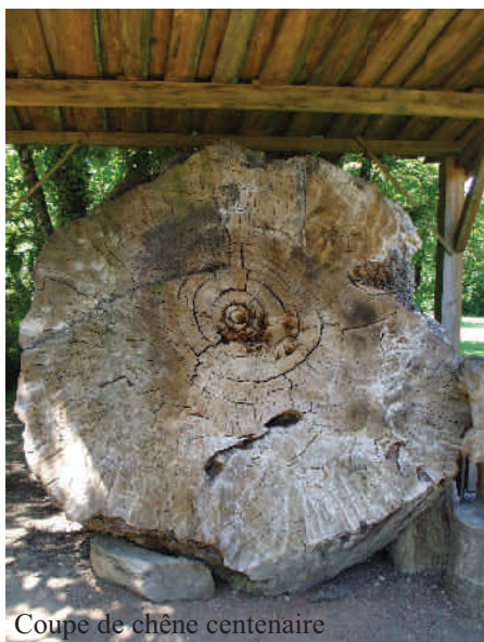
Coupe de chêne centenaire