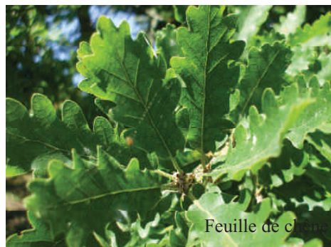
Feuille de chêne