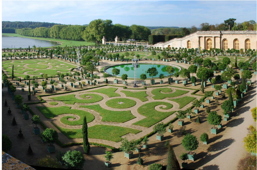
Le jardin du château de Versailles