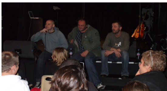
Le groupe syrrano