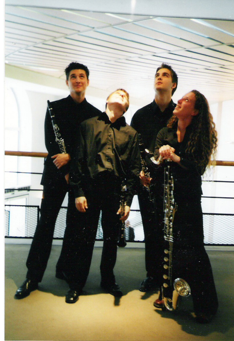
Les hanches hantées