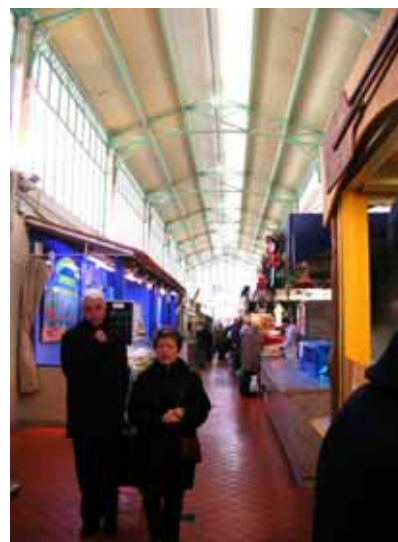
Marché couvert : les halles