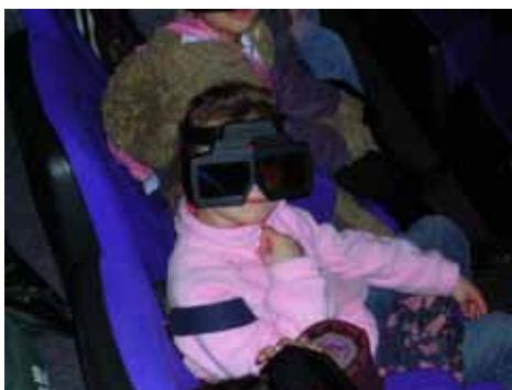
Les lunettes 3D