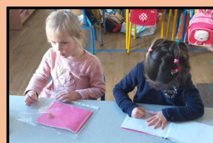
Les ateliers autonomes