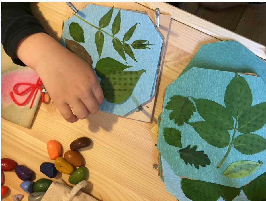
Liya, la fille de Coralie, a ramassé beaucoup de feuilles d'arbre et elle les a collées puis décorées.