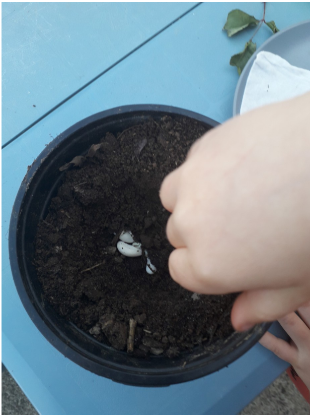
Mathieu a fait germer des graines de haricot.