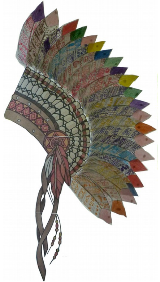
Les réalisations des GS

Pour terminer sur ce thème, les grande section ont également fabriqué des attrape-rêves. Il s'agit d'un objet utilisé dans beaucoup de tribus amérindiennes, auquel on prête le pouvoir de capturer les cauchemars afin de permettre à son propriétaire des nuits paisibles.