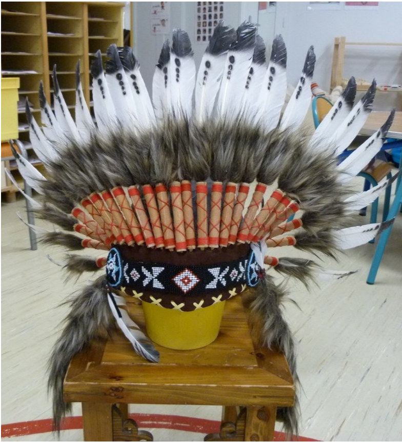
La « vraie » coiffe