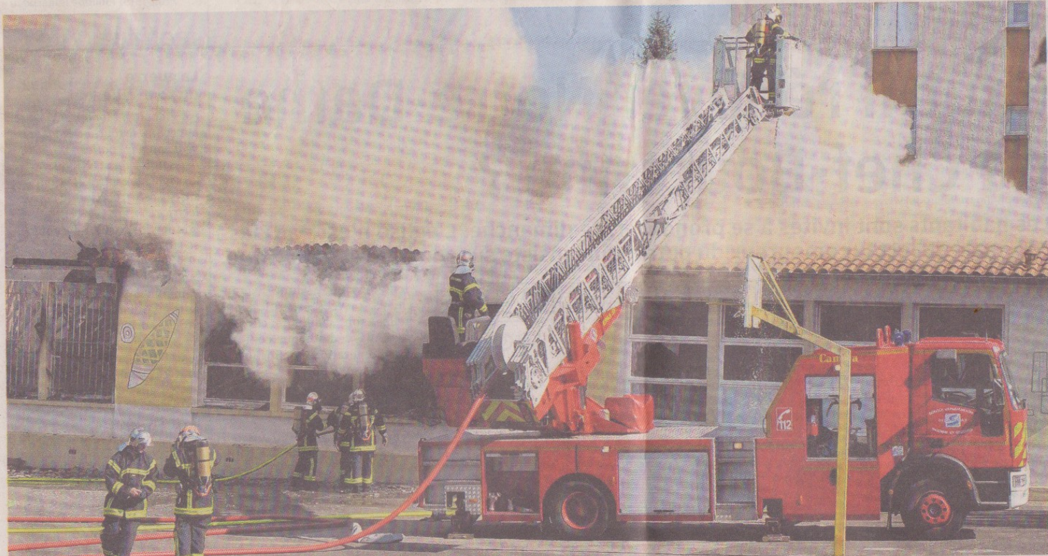
Un bâtiment de l'école primaire Gutenberg a été ravagé, hier après-midi, à Parthenay. Les quarante élèves qui s'y trouvaient ont pu sortir à temps.