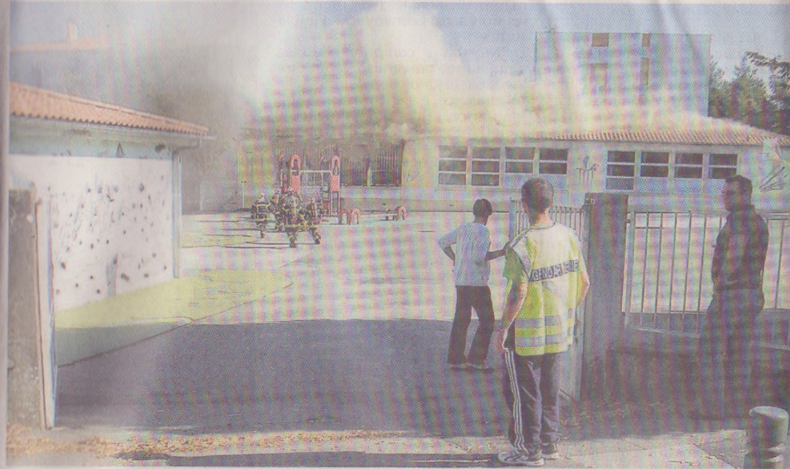
Parthenay, hier après-midi. L'incendie a pris dans la salle informatique de l'école Gutenberg de Parthenay et s'est rapidement propagé aux deux salles adjacentes.

Dès le début, une grosse colonne de fumée noire pouvait se voir à des kilomètres à la ronde, attirant les curieux. A l'arrivée des forces de l'ordre et des pompiers, ils étaient d'ailleurs nombreux. Quelques-uns cherchant à se rendre utiles, tel ce patron de discothèque essayant d'enlever les poteaux métalliques disposés là pour empêcher tout stationnement de voiture, mais gênant les manœuvres des véhicules d'incendie. Les 23 pompiers déployés sont rapidement venus à bout du feu puisque l'incendie était éteint aux alentours de 16 h. Le chef de groupe était l'adjutant-