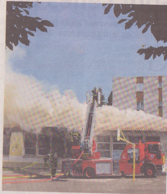
Une trentaine de pompiers, dirigée par le commandant Poujade, est venue à bout du sinistre au bout de deux heures. Le bâtiment a été complètement détruit.

Voir également la vidéo sur le site internet NR : http://bit.ly/qdswck