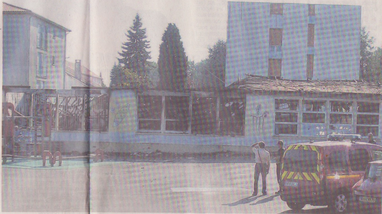
Parthenay, samedi 1 er octobre. Du bâtiment qui abritait la salle d'informatique, la bibliothèque et la CLIS, il reste des ruines.

Le 30 septembre, le feu parti de la salle informatique de l'école Gutenberg ravageait l'immeuble de trois salles. Répartis dans d'autres établissements, les élèves réintégreront leur école le 17 novembre.