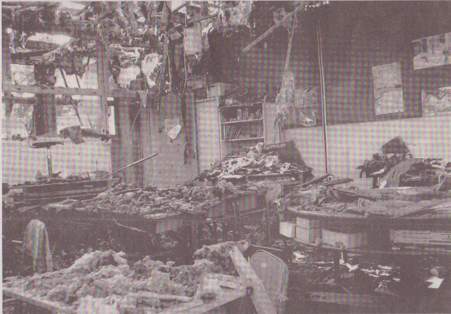
Après l'incendie du 30 septembre, a entièrement détruit un bâtiment de l'école sans heureusement faire un seul blessé.

Après l'incendie du 30 septembre qui a détruit un bâtiment, les élèves de l'école Gutenberg retrouvaient hier leur établissement. Mais cette rentrée a failli ne pas avoir lieu pour raisons de sécurité.