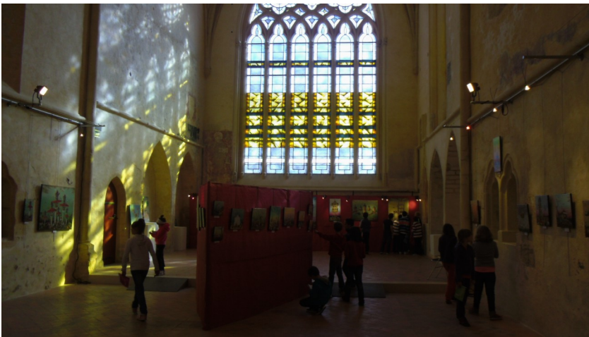
La visite de l'exposition

http://sites79.ac-poitiers.fr/gutenberg-parthenay/