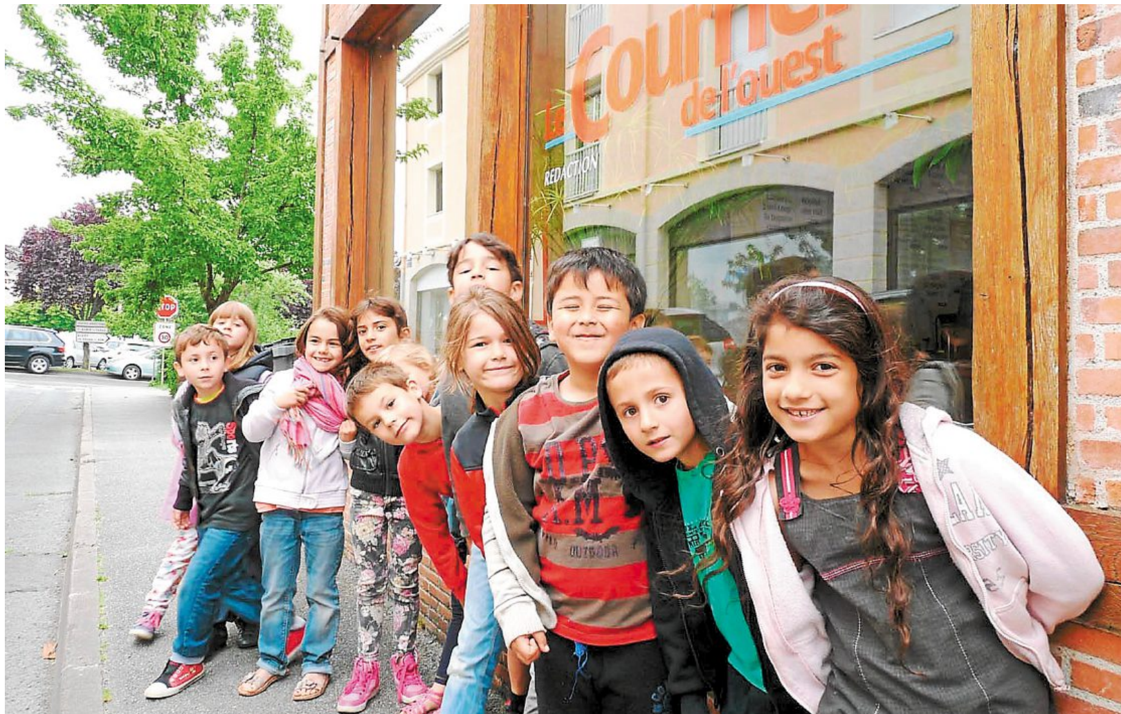
Parthenay, rue Louis-Aragon, mercredi 18 juin. Les élèves de CP de l'école Gutenberg, répartis en deux groupes, ont découvert la rédaction du Courrier de l'Ouest.