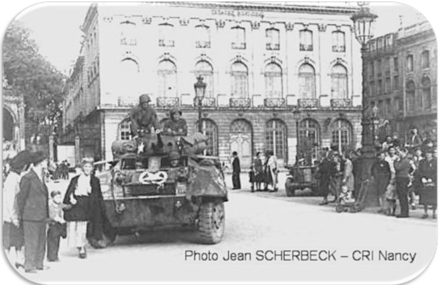
15 septembre 1944. La libération de Nancy - place Stanislas