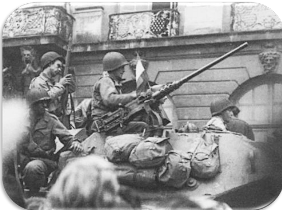
15 septembre 1944.

La libération de Nancy éléments du bataillon 654ème TD, attaché au régiment d'infanterie 134e division d'infanterie 35e, entrer dans la ville.